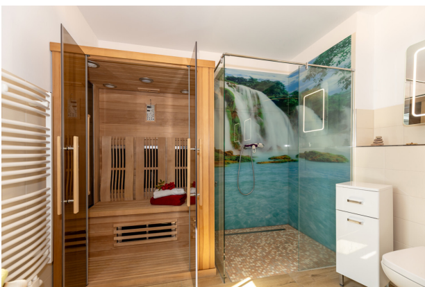
Bad mit Sauna