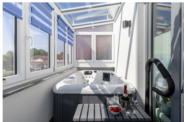
Whirlpool im Wintergarten