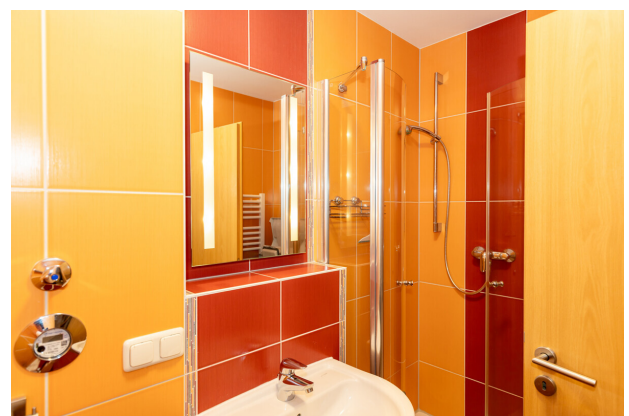
Bad 1 mit Dusche