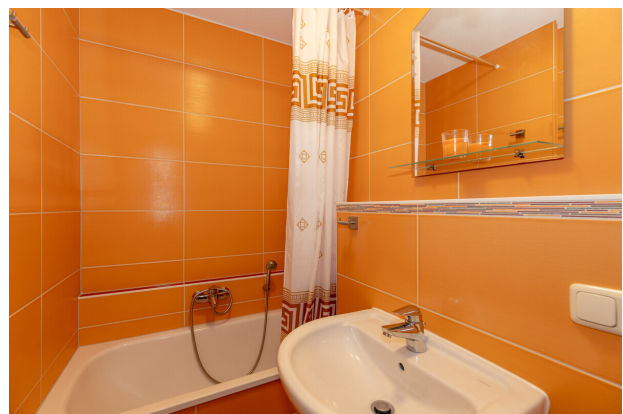
Bad 2 mit Wanne