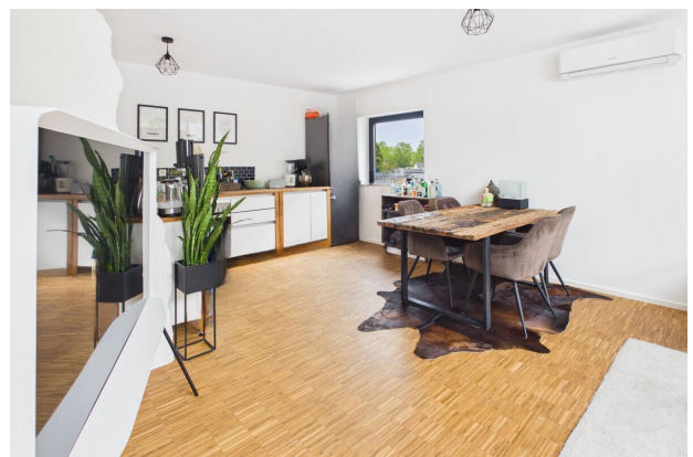
Wohn- & Essbereich