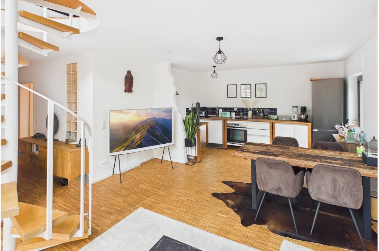
Wohn- & Essbereich