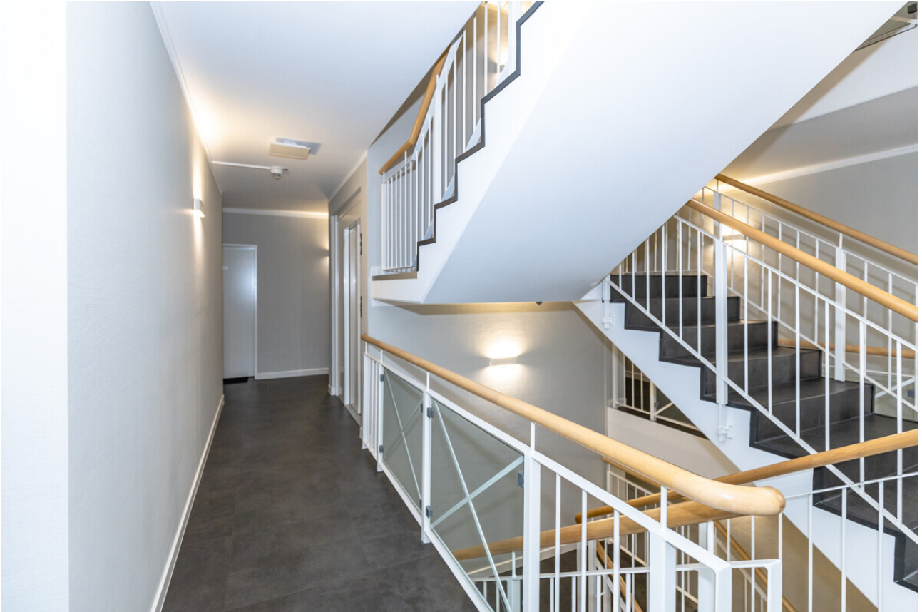
modernes Treppenhaus mit Aufzug