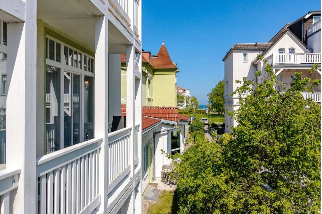
Ausblick zur Ostsee